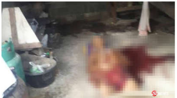
ลูกทรพีฆ่าแม่เสียชีวิตขณะไปหว่านปุ๋ย 10 แม่หนีเงินขอแม่ฆ่าแม่